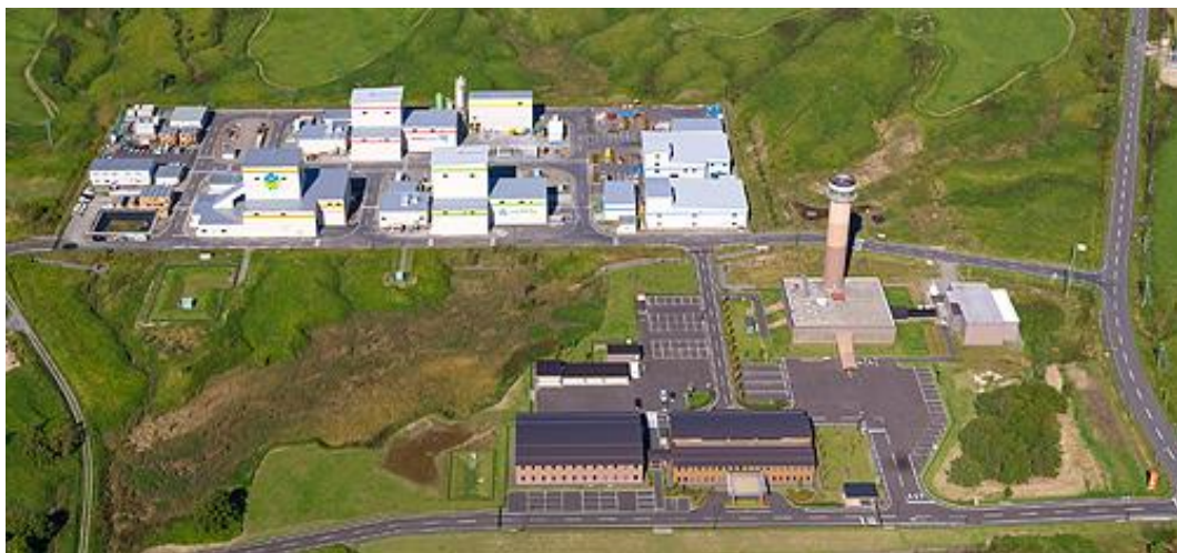
Fig 4 日本原子力研究開発機構・幌延深地層研究センター ゆめ地創館，地層処分実規模試験施設，バーチャル地下施設，西立坑アクセスルーム，排水処理設備