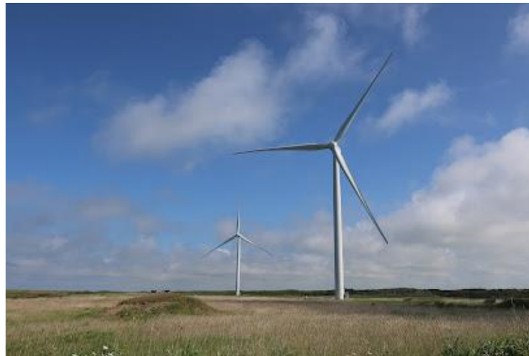
Fig 3 ユーラスエナジー・浜里ウィンドファーム シーメンスガメサ・リニューアブル・エナジー4,300kW×14 基