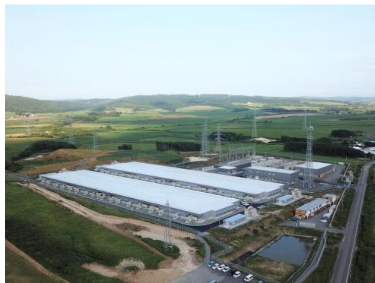
Fig 2 北海道北部風力送電・北豊富変電所 国内最大のリチウムイオン蓄電池設備