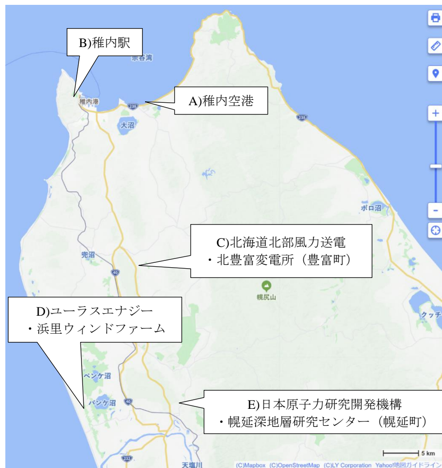
Fig 1 視察先地図（稚内市，豊富町，幌延町）